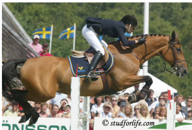
Fig. BUTTERFLY FLIP