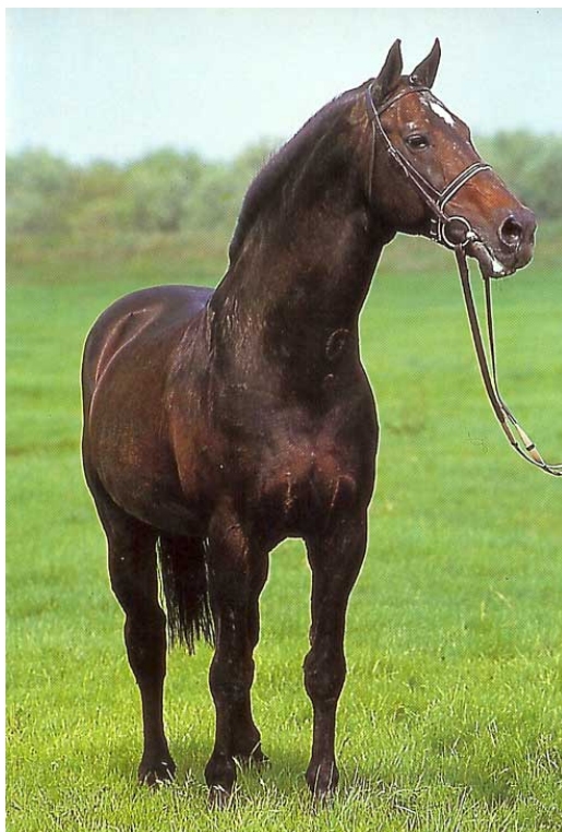
Landgraf aos 30 anos de idade

No dia 10 de Abril de 1996, os criadores da região de Holstein celebraram, com grande pompa, seu charmoso garanhão LANDGRAF em uma cerimônia que também premiou sua progênie: LIBERO, TAGGI e outros performers internacionais.