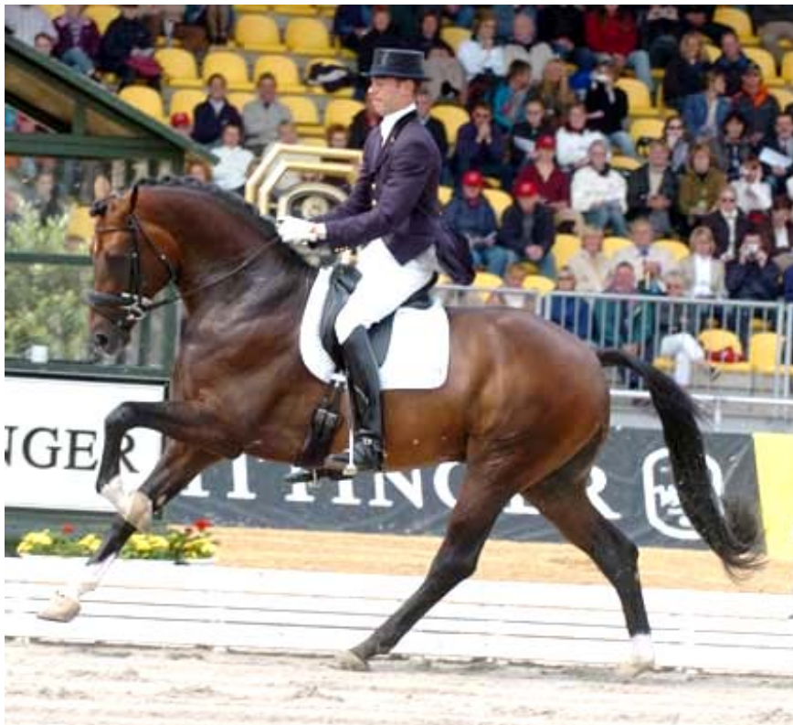
Fig 14 - FLORENCIO

Ainda em 2007, FURIOSO II continua sua influência nos saltadores. Citação do Annuaire 2007/2008 Monneron: "Em um Ranking dos TOP 75 melhores garanhões de salto Mundiais (resultados FEI de 2515 cavalos competindo em nível CSI), encontramos VOLTAIRE como o 11º classificado, com 19 filhos vencedores em CSI e FOR PLEASURE como o 13º, com 11 filhos vencedores".