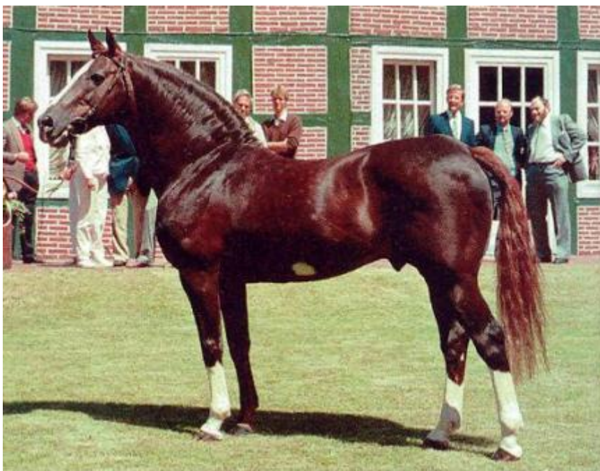
Fig. 10 – FURIOSO II

FURIOSO II entrou para o seleto clube dos garanhões milionários pelos ganhos de seus produtos na Alemanha (DM 9.000.000,00) e resto da Europa e produziu vencedores nas 3 disciplinas. É pai dos fantásticos FOR PLEASURE e VOLTAIRE. FURIOSO II produziu simplesmente 81 garanhões aprovados, 96 mães de garanhões aprovados e 200 Éguas Elite. Seus filhos FBI (Thomas Frühmann) e HEISSMANN (Michael Matz) também foram olímpicos.