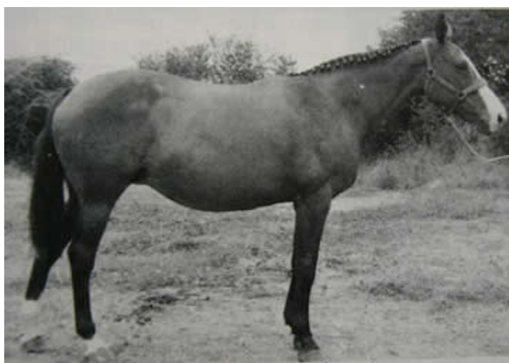
Fig. 8 - TANAGRA

Éguas como a conhecidíssima TANAGRA (FURIOSO x DELICIEUSE por JUS DE POMME), uma das éguas mais importantes da criação francesa. Ela é mãe do garanhão Olímpico JALISCO B (pai ALMÉ), que por sua conta é pai do raçador número 1 dos anos 90: QUIDAM DE REVEL e dos importantes QUITO DE BAUSSY, SURCOUF DE REVEL, PAPILLON ROUGE, ALEGRETTO, DOLLAR DU MURIER, entre muitos. TANAGRA ainda é a mãe de QUANAGRA (pai GALOUBET) – mãe do bom garanhão francês CABDULLA DU TILLARD e de outra égua excelente da criação francesa, GUEISHA N, (nível GP com Eric Navet) e mãe dos garanhões KISSOVO e do excelente EPHEBE FOR EVER LA SILLA (por Galoubet) (Equipe Francesa).