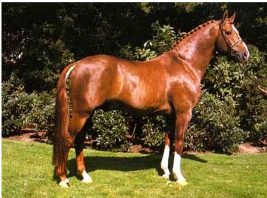
Fig. 13 – FREIHERR