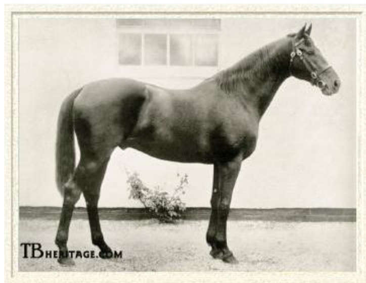
Fig.5 – DARK RONALD