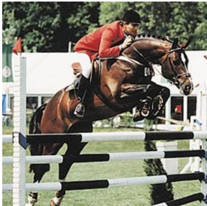
Fig.12 - VOLTAIRE

VOLTAIRE (FURIOSO II em GOGO MOEVE por GOTHARD) é seguramente o filho mais importante de FURIOSO II no sentido de patrimônio genético e perpetuação da linha masculina do PSI FURIOSO. Assim como FOR PLEASURE, ele se provou na pista, competindo e vencendo em Nível de GP por toda a Europa. O jovem VOLTAIRE não passou na aprovação em Oldenburg. Acabou adquirido por Henk Nijhoff e levado para a Holanda, onde iniciou carreira em pista e na reprodução. É pai de muitos cavalos de esporte espetaculares, montados por cavaleiros de todo o mundo, como CONCORDE – Medalhista Olímpico Barcelona (Jos Lansink), FINESSE (Emile Hendrix), PLAY IT AGAIN (Ian Millar), ALTAIR (Beth Underhill), DANTE (Rob Ehrens), ELEKTRO (Peter Eriksson), FLYER (Philippe Rozier), GYLTAIRE (Michael Whithaker) e HELIOS (Hubert Bourdy). VOLTAIRE é considerado Chef de Race na Holanda tem mais de 20 filhos aprovados. Por enquanto CONCORDE (também cavalo Olímpico) é o garanhão que mais importante de sua linhagem.