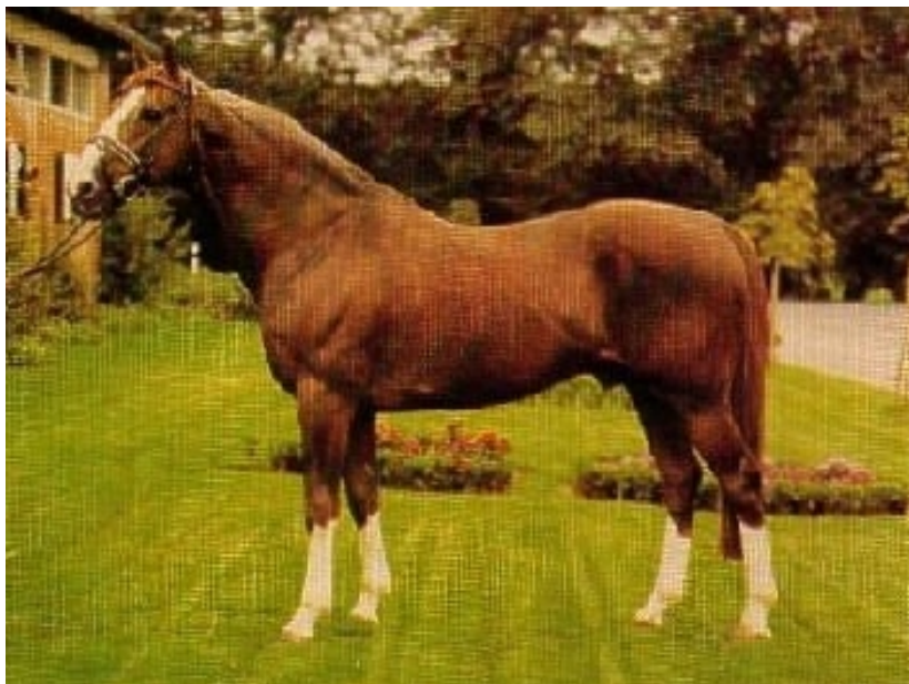
Fig. 9 - FUTURO

FUTURO (FURIOSO X FABIENNE por VERT GALANT), aprovado em Oldenburg e posteriormente em Hannover, Rheinland, Westfália e Mecklenburg, teve grande influência mais por conta do enorme número de éguas cobertas por ele do que efetivamente por sua qualidade em si como garanhão, uma vez que sua linha baixa também não era uma linha de maior importância, mas sim as éguas que lhe foram apresentadas eram de boa qualidade.