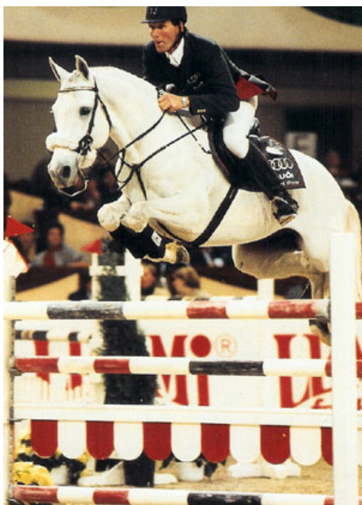
Fig.7 – CHAMPION DU LYS

LAEKEN (FURIOSO x HERTA por FLUGEL VAN LA ROCHE) é o pai do excelente garanhão KWPN de propriedade do Stud VDL: CHAMPION DU LYS, vencedor de seu ano de aprovação e campeão por equipe no Campeonato Europeu em Hickstead 1999 com Ludger Beerbaum. Essa linhagem está produzindo bem atualmente e os Campeões Mundiais de Cavalos novos de 2007 em Lanaken, OPERA DE RIZZI (5 anos) – mãe filha de LAEKEN e CABALLERO (7 anos) filho de CHAMPION DU LYS são a prova do retorno da linha de FURIOSO aos papéis modernos.