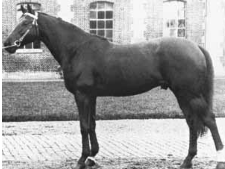
Fig.1 – FURIOSO

FURIOSO foi um PSI da linha de sangue do famoso MATCHEM e era filho de PRECIPITATION em MAUREEN, por SON IN LAW. Foi criado pela família Macdonald-Buchanan. Apesar de ter sido criado para corridas rasas, seu pedigree combina influências que podem ser encontradas na maioria dos bons corredores de Steeplechase (Corrida com obstáculos). Na linha paterna ele descende de MARCO-MARCOVIL-HURRY ON, através dos quais ele é aparentado com 19 grandes vencedores de corridas com obstáculos.