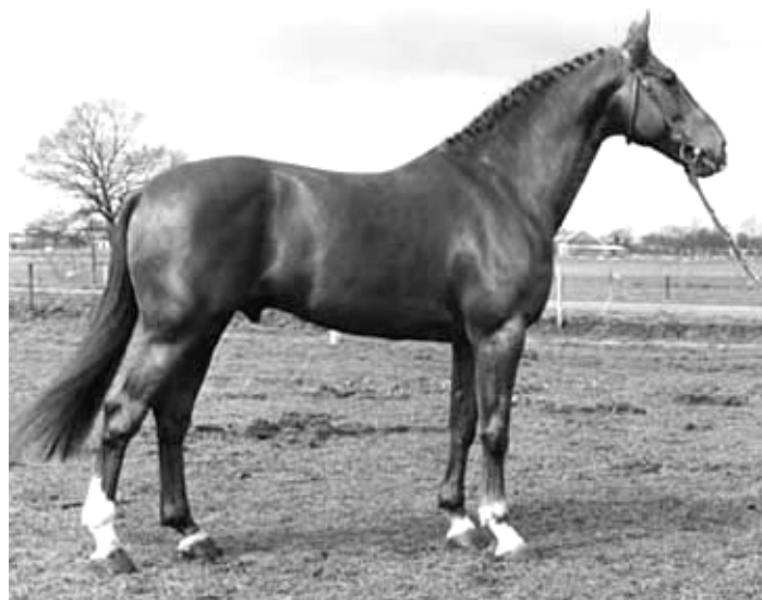
Fig 15 – LE MEXICO