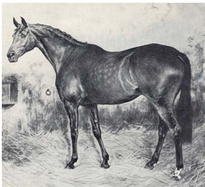
Fig.6 – LUTTEUR B

FURIOSO foi o Garanhão Líder das estatísticas francesas de vencedores de 1954 a 1961. Seu filho LUTTEUR B, que foi medalha de ouro individual nas Olimpíadas de 1964 com Pierre d´Oriola, causou estardalhaço entre os criadores Alemães quando se apresentou e venceu o Derby de Hamburgo. O grande criador Maas Hell, no livro Die Grossen Hengste Holsteins, recorda a reação: " ... os alemães ficaram novamente maravilhados em como o cavalo francês Lutteur B se apresentava nas pistas de competição, em como ele brincava com as distâncias entre os obstáculos e com suas larguras, terminando o percurso com extrema facilidade e saindo de pista tranquilamente com o pescoço alongado e as rédeas soltas, como se nada tivesse acontecido ".