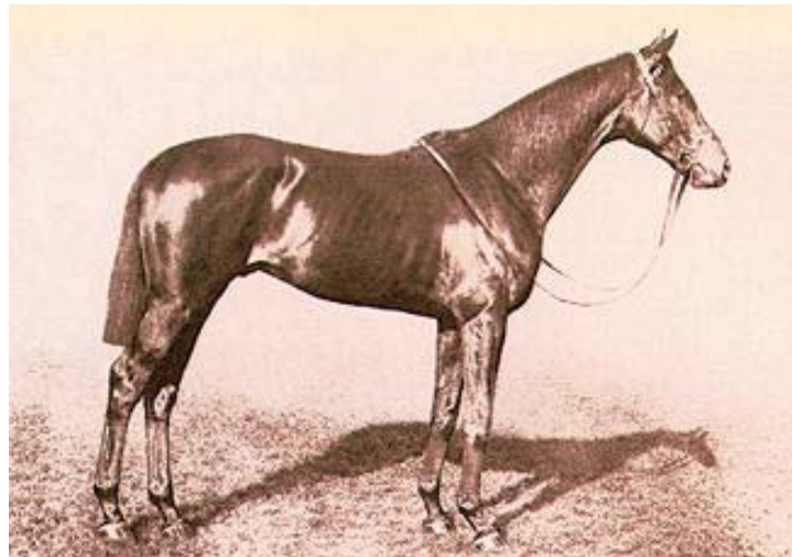
Fig 4 – BAY RONALD

O pai de SON IN LAW era o garanhão DARK RONALD, um filho de BAY RONALD – o PSI que estatisticamente mais aparece no pedigree dos grandes saltadores e de muitos cavalos de Adestramento em todas as raças de esporte. BAY RONALD nasceu na Inglaterra e foi exportado para a França, onde produziu a égua RONDEAU, mãe do garanhão TEDDY (usado na criação de Warmbloods na Alemanha, França, USA e Itália). Para termos idéia de sua influência, DARK RONALD está presente nos pedigrees dos famosos PSIs LADYKILLER (pai de LANDGRAF e LORD), MANOMETER (importante garanhão em Holstein), VALENTINO, NECKAR, DER LOEWE e WAIDMANNSDANK, PIK AS (usados em diferentes criações alemãs) e NIGHT AND DAY (França). No Adestramento, DARK RONALD aparece no pedigree dos alemães DONNERHALL, WORLD CUP I e II, WERTHER e PIK BUBE.