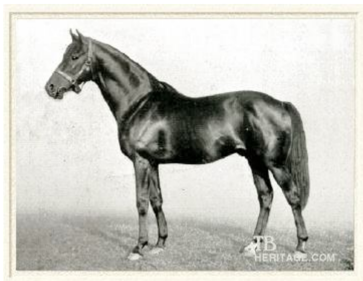
Fig-3 SON IN LAW

MAUREEN, mãe de FURIOSO , é tinha uma somatória incomum de cavalos de grande aptidão desportiva e para salto em sua ascendência. Ela é filha de SON IN LAW, que é outro garanhão de importância máxima em cavalos com aptidão para salto neste século. SON IN LAW foi um dos melhores fundistas e pai dos melhores fundistas da primeira metade do século XX. Passava aos seus filhos stamina e um inacreditável aguerrimento (stout). SON IN LAW era um garanhão forte e masculino, de pernas longas, lombo curto, com uma espádua tremenda e garupa bastante inclinada. Em geral seus filhos não eram precoces e melhoravam muito com a idade.