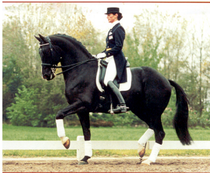
Fig.16 – OLYMPIC FERRO