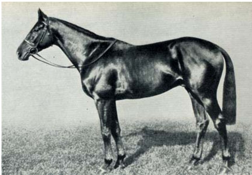
Fig. 2 - PRECIPITATION

PRECIPITATION, pai de FURIOSO , foi vencedor em 7 corridas das 10 que disputou. De acordo com o livro Thoroughbred-Breeding of the World , editado por Rainer L. Ahnert: "O imbatível HURRY ON produziu três vencedores de Derby: Captain Cuttle, Coronach, Call Boy e o fantástico stayer (fundista = cavalo que corre longas distâncias) PRECIPITATION. HURRY ON era um alazão grande, de mais de 1.70m, com excelente ossatura, bons aprumos e stamina (resistência) ilimitada, que passava sistematicamente essas características para seus descendentes.