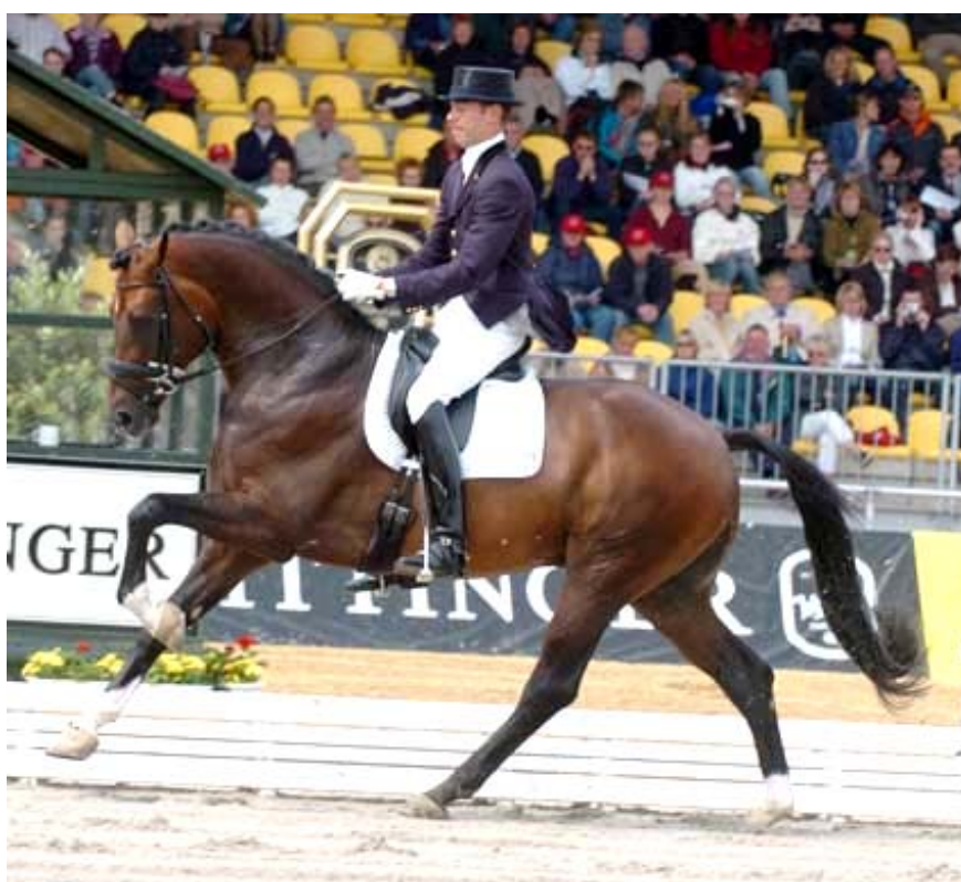
Fig 14 - FLORENCIO

Ainda em 2007, FURIOSO II continua sua influência nos saltadores. Citação do Annuaire 2007/2008 Monneron: "Em um Ranking dos TOP 75 melhores garanhões de salto Mundiais (resultados FEI de 2515 cavalos competindo em nível CSI), encontramos VOLTAIRE como o 11º classificado, com 19 filhos vencedores em CSI e FOR PLEASURE como o 13º, com 11 filhos vencedores".