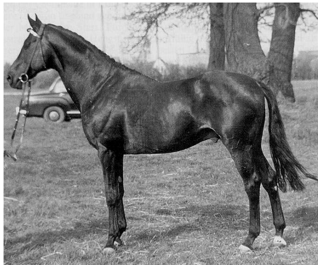
Fig.7- O PSI Cottage Son

(cheque mais sobre essa linhagem no link sobre FURIOSO XX: http://harasfb.com.br/pdf/FURIOSOponto.pdf )