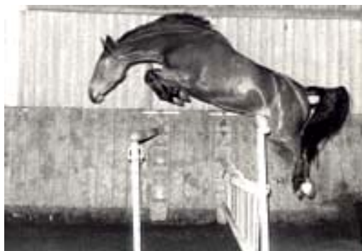
Fig.5- A categoria de FOLIA

Um dos primeiros produtos de FOLIA foi KAUSA, com Freeman (Frvol XX). Essa égua saltou e venceu muitas provas de 1:35m (CSI) e voltou para a cria, onde produziu o garanhão CADILLAC (Caletto II), que competiu em nível de GP por anos com Peter Wetzel e produziu 7 saltadores Internacionais também. KAUSA é também a mãe do garanhão LORDANO (LORD XX).