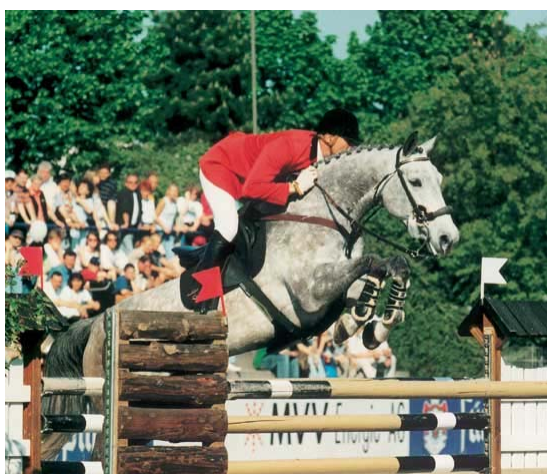
Fig.13- CHARLOTTENHOF 'S CHARISMA