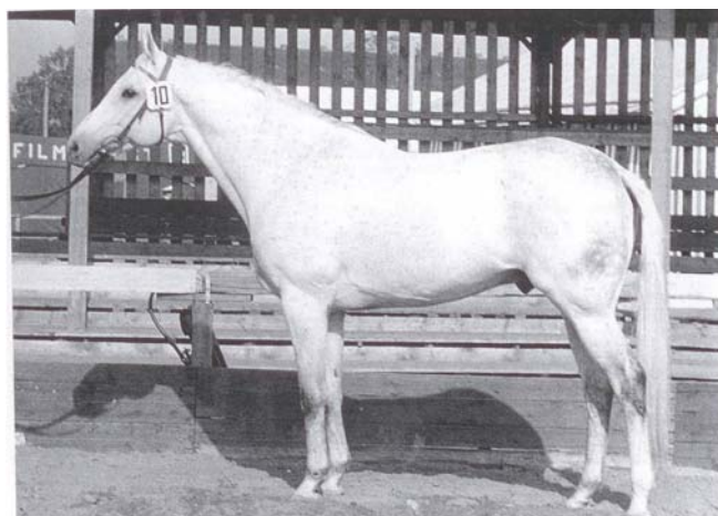
Fig.4- MANOMETER XX

MANOMETER XX, o PSI pai de MAXIMUS teve boa influência na criação Holsteiner: MANOMETER era filho do Vencedor do Derby Alemão ABENDFRIEDEN. ABENDFRIEDEN era irmão inteiro do famoso PSI ANBLICK, que cobriu em Holstein de 1950 a 1964, tendo coberto durante os 8 anos anteriores em Hannover. ANBLICK foi um importante raçador de fêmeas, notadamente as mães de LANDGRAF I e de JOOST (no KWPN). Além de MANOMETER, ABENDFRIEDEN foi pai dos importantes PERSER XX e de PIK AS XX, que cobriu em Hannover de 1952 a 1969, com descendentes do nível do Campeão Mundial MR.T (Wholan) e o vencedor da Copa do Mundo ARAMIS (Artwig) . MANOMETER era um tordilho de 1,62m que cobriu em Holstein de 1962 a 1968, depois foi exportado para a Dinamarca. Possuía uma cabeça nobre e pescoço pesado. Ótima espádua e era um bom saltador. Seu galope não era dos melhores, mas passava aos seus filhos um excelente temperamento, aptidão para salto e honestidade a toda prova. Teve 5 filhos aprovados e 85 filhas registradas em Livro Superior. Seu filho mais famoso foi MAXIMUS, mas também são bons os garanhões MARCONI e MARINUS, pai do conhecido METELLUS, que teve grande influencia na criação do Sela Argentino.