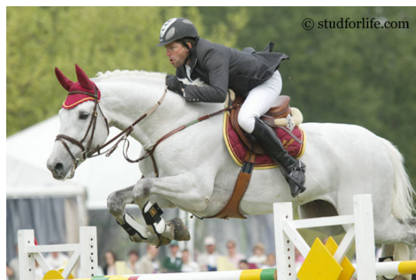
Fig.22- CASSINI II

Ainda na Alemanha, o fenômeno CENTO, merece ser comentado. DÖBEL'S CENTO (mãe Caletto II) venceu entre outras competições importantes a Copa do Mundo de 2002 e os J.O. de Sydney por Equipe. Venceu mais de 1 milhão de EURO em competições. CENTO possui filhos aprovados em praticamente toda a Europa e mais de 30 filhos competindo regularmente em provas acima de 1:50m, como Controll /Otto Becker, Kaprice de Faible/Christian Hess, Cinquecento/Tobias Bachl, e Charleston/Otto Becker. Ainda merecem citação os internacionais bem atuais: CORDINA, Chippendale Z, CHAMPAGNE e CENTINO DU RY. Na Bélgica, há um filho seu muito talentoso recém aprovado chamado CADENCE v't GELLUT (mãe Jus de Pomme). O sêmen de CENTO também não é de boa qualidade, infelizmente, o que reduz sua produção.