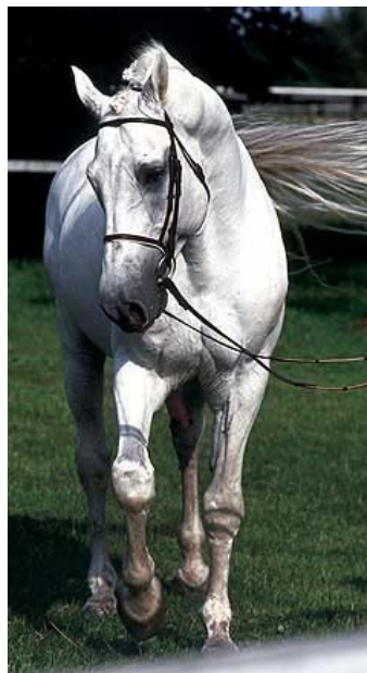
Fig.11- CAPITOL I

A primeira geração de CAPITOL I foi ansiosamente aguardada: 35 potros – 20 machos e 15 fêmeas nasceram em 1979, a maioria no leste de Holstein. "CAPITOL teve uma base de éguas com boa orientação esportiva" reflete Dr. Nissen. Mas nem todos seus filhos convenceram. "Eram potros bonitos, com belas cabeças e boa movimentação, mas um ou outro saía excessivamente pesado de tipo" cita Fehrs. Nissen completa: "CAPITOL precisava de linhas de sangue refinadas, seus melhores filhos foram frutos de éguas altamente refinadas ou de éguas com COR DE LA BRYÈRE (Rantzau) no pedigree." Provavelmente o mais convincente exemplo da força hereditária do tordilho foi o CHIO de Aachen de 2000: Cento venceu o desempate do GP com Otto Becker, seguido de perto por seu meio-irmão Carthago. Ambos filhos de CAPITOL I e ambos ganhões aprovados.