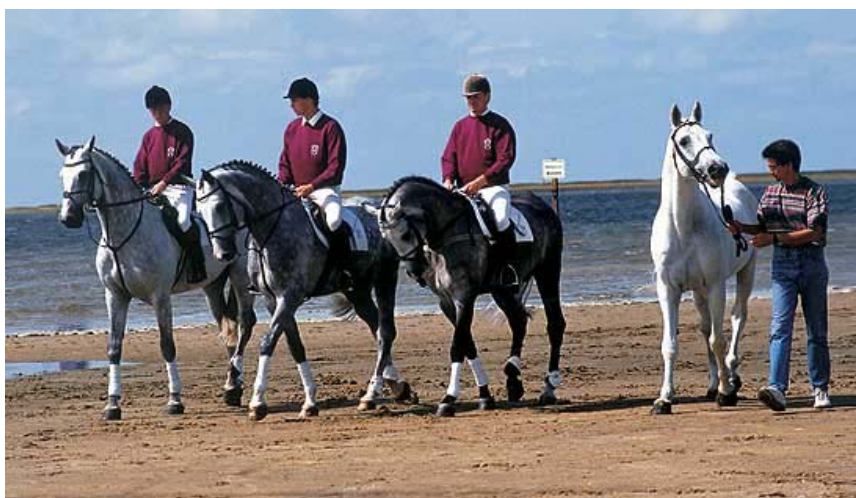
Fig.6- CAPITOL I e seus filhos garanhões: CARTHAGO , CASSINI e CAMPIONE

CAPITOL foi o mais influente produtor de saltadores da última década, confirmado pelo seu enorme número de descendentes que saltaram internacionalmente, incluindo aí: CARTHAGO, CAPRIOL, CENTO, CASSINI I, CELANO, CAROLUS, etc., que discutiremos separadamente mais a frente.