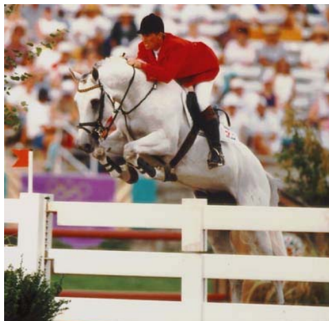
Fig.17- CARTHAGO Z