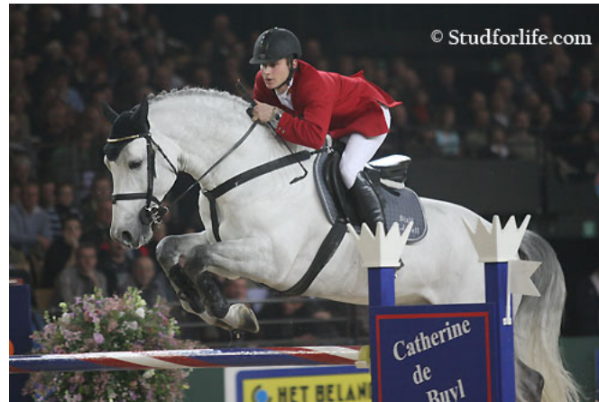
Fig.8- Quite Capitol