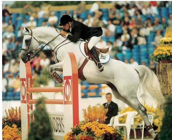
Fig.23- VDL CARDENTO

VDL INDOCTRO (mã CALETTO) foi líder de estatística KWPN e Européia e também teve uma excelente carreira desportiva de nível nacional com Ulrich Kirchhoff. É pai de muitíssimos craques e garanhões aprovados. São seus filhos ORAMÉ (mã Ramiro), NO LIMIT (mã Purioso) e WITTINGER (mã Nimmerdor) foram vencedores de suas aprovações. Animais desportivos como Casadora, Nike (J.O.) , Youp, Nassau (J.O.) , Black Ice, Picolien Zeldenrust (J.O.) Robin, VDL Maserati, Nobel, Omona, Maddock, Meatloaf, VDL Orestus, October, Oderike, VDL Montreal, Minka's Diamond, Naf Naf, Owaola, Orchidee e Oscar, são todos participantes de provas internacionais série forte.