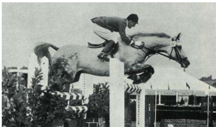
Fig.2 - O Excepcional ROMANUS

ROMANUS (por RAMZES) e CAPITOL (por Capitano) são apenas dois entre os vários nomes de peso que tem RAPPEL em sua descendência.