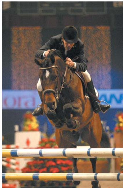
Fig.9- Quite Easy

Unindo os ganhos dos filhos, netos e bisnetos da égua FOLIA, chegamos à incrível soma de mais de 3 milhões de EURO. Com certeza uma égua muito importante para a criação Holsteiner.