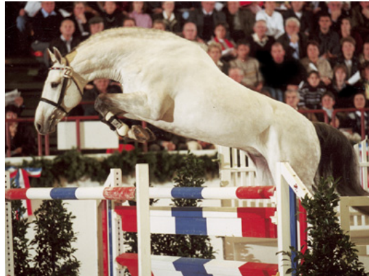
Fig.21- CASSINI II

mais interessante no momento é CASSKENI Z (mãe Chamonix), aprovado em Holstein e Zangersheide. Aos 7 anos de idade, CASSINI II já apresentou filhos vencendo em CSI, como CASSIUS, CENTURIO e CAPRIOLO.