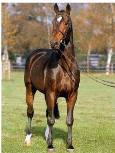
Fig.8- Latus II

LATUS II (Landgraf I) nasceu em 1981 e foi vendido para o conhecido criador Maas Hell como futuro garanhão. Era um animal grande e menos refinado que seu irmão mais velho, com uma cabeça um pouco pesada. Mas saltava mais ainda que seu irmão. LATUS II produziu vários cavalos de nível GP, como Montanus Laredo, Sandstone, Landsmann, Lotus e Laconda.