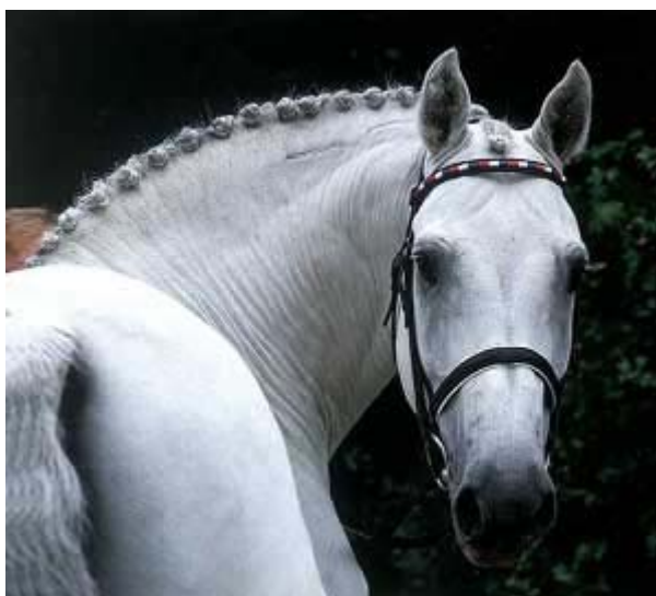
Fig.1- O Tordilho CAPITOL I

Imaculadamente branco, explodindo de energia, completamente seguro de si, CAPITOL I lembrava um cavalo de Contos-de-Fada. Este monumental garanhão é atualmente considerado o maior produtor de cavalos de salto da criação Holsteiner e da Alemanha. Seus filhos já ganharam mais de 2.5 Milhões EURO em competições por todo o mundo e estão presentes em Campeonatos Europeus, Mundiais e Olimpíadas. Na Olimpíada de Sydney, 4 filhos seus participaram. Apenas filhos de Landgraf I, Pilot, Polydor, Furioso II, Grannus e Lord venceram mais premiações em dinheiro. "CAPITOL I tem sido a melhor propaganda da raça Holsteiner. Ele é muito estimado por sua excepcional capacidade de salto, enorme habilidade, sua vontade de trabalhar e ótimo temperamento – características que ele passa muito consistentemente aos seus filhos" - comenta Dr. Thomas Nissen, Diretor de Criação da Associação de Holstein.